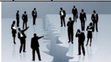
Раскол в коллективе