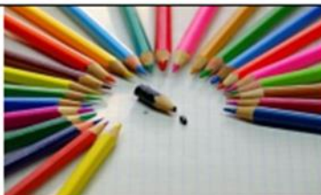
Настрой коллектива против «антилидера»